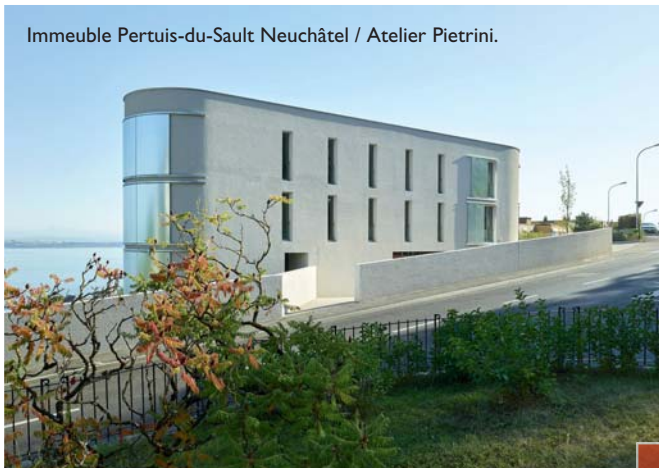
Immeuble Pertuis-du-Sault Neuchâtel / Atelier Pietrini.