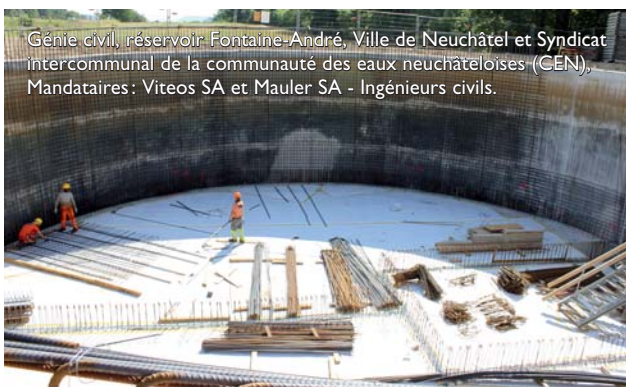
Génie civil, réservoir Fontaine-André, Ville de Neuchâtel et Syndicat intercommunal de la communauté des eaux neuchâteloises (CEN), Mandataires: Viteos SA et Mauler SA - Ingénieurs civils.

croître leurs échanges, leur communication et leurs actions pour faire avancer de concert nos problématiques et allier nos énergies pour plus de force. Ceci porte ses fruits et pour preuve, un groupe semblable s'est formé en Suisse alémanique! Concernant la SIA Neuchâtel, être avec d'autres sections nous donne de l'impulsion et une motivation supplémentaire pour agir. Afin de mener à bien nos actions, un comité et une coordinatrice sont à l'œuvre. Ainsi, nous nous réunissons entre quatre et six fois par an pour débattre autour des sujets d'actualité et nous constatons que depuis que ce groupe a été créé, nous avançons sur de nombreux projets. L'union fait la force!