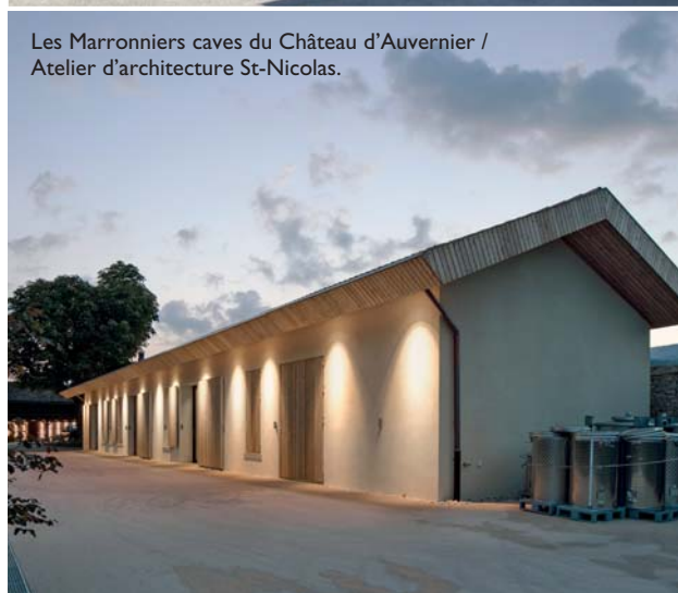
Les Marronniers caves du Château d'Auvernier / Atelier d'architecture St-Nicolas.

croître leurs échanges, leur communication et leurs actions pour faire avancer de concert nos problématiques et allier nos énergies pour plus de force. Ceci porte ses fruits et pour preuve, un groupe semblable s'est formé en Suisse alémanique! Concernant la SIA Neuchâtel, être avec d'autres sections nous donne de l'impulsion et une motivation supplémentaire pour agir. Afin de mener à bien nos actions, un comité et une coordinatrice sont à l'œuvre. Ainsi, nous nous réunissons entre quatre et six fois par an pour débattre autour des sujets d'actualité et nous constatons que depuis que ce groupe a été créé, nous avançons sur de nombreux projets. L'union fait la force!