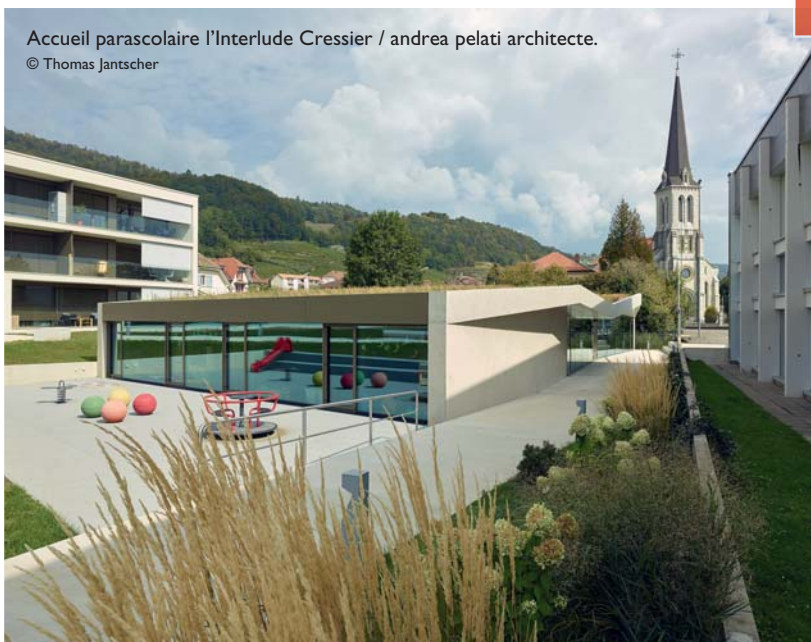
Accueil parascolaire l'Interlude Cressier / andrea pelati architecte.

La SIA Neuchâtel va accueillir plusieurs expositions itinérantes installées dans des lieux publics, la première, conçue par nos confrères de la SIA Jura/Jura bernois, permettra d'aborder le sujet des dangers naturels comme les inondations ou, les glissements de terrain de manière légère, par des photos, des maquettes ou des installations interactives. Destinée autant aux jeunes qu'à toutes les personnes intéressées, elle va donner l'occasion de débattre de ces sujets de plus en plus fréquents: comment faire pour limiter ces dangers? Une autre, réalisée par l'association indépendante «Le concours suisse pour le congrès de l'Union internationale des architectes (UIA)» à Rio en été 2021, aura pour thème les concours d'architecture. D'envergure nationale, cette exposition sera à son retour du Brésil retravaillée canton par canton pour mettre en exergue